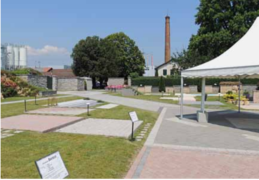
Figure: BFT International

A show garden exhibiting various Cornaz products was installed directly on the Allaman production site